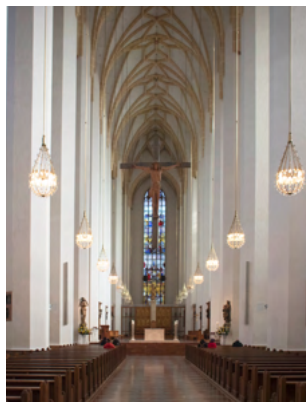
La vista verso l'altare della Frauenkirche è suggestiva.

Tra l'altro, le caratteristiche coperture delle torri sono ispirate alla Cupola della Rocca di Gerusalemme, uno dei santuari più importanti dell'Islam. Se vi entusiasma godere della vista, potete farlo: la torre sud della Frauenkirche è aperta al pubblico. Prima si sale una scala a chiocciola di 89 gradini, poi un ascensore porta all'ambiente in cima alla torre. Prima, però, c'è un altro piccolo ostacolo da superare: l'"impronta del diavolo" nell'area d'ingresso della navata. Quando sarete sul posto scoprirete la leggenda.