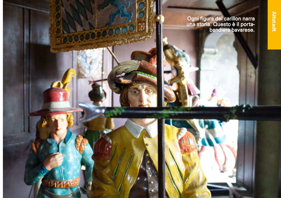
Ogni figura del carillon narra una storia. Questo è il portabandiera bavarese.

Presso il nostro Tourist Info nel Neues Rathaus oppure su simply-munich.com/offerte potete prenotare salite alla torre del Rathaus e alla torre sud della Frauenkirche, visite guidate al Rathaus, alla Residenz e all'Hofbräuhaus e molto altro ancora.