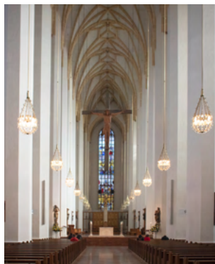
La vista del altar de la Frauenkirche es sobrecogedora.

Por cierto, las preciosas cúpulas que adornan las torres están inspiradas en la Cúpula de la Roca de Jerusalén, uno de los santuarios más importantes del Islam. Quien sienta la necesidad de subir a las torres, está de suerte: la torre sur de la Frauenkirche está abierta a los visitantes. Pero para ello tendrá que subir 86 escalones por una escalera de caracol, y desde allí podrá seguir en ascensor hasta la sala de la torre. Pero antes deberá superar otro pequeño obstáculo: la «huella del diablo» en la zona de entrada de la nave. Allí podrá averiguar de qué va esta leyenda.