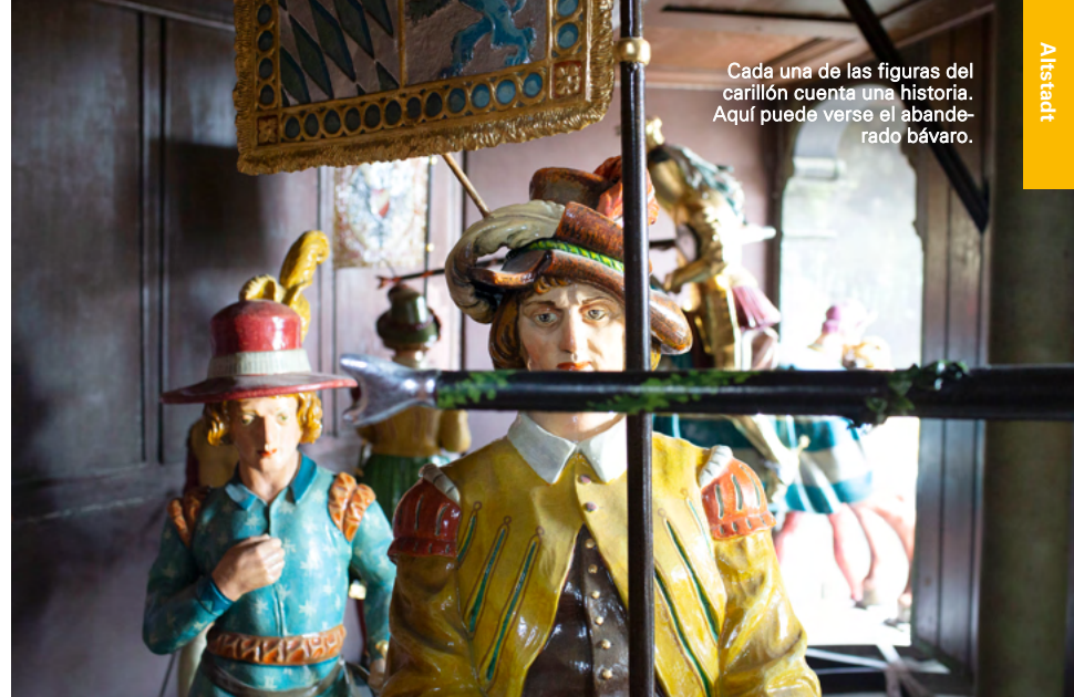
Cada una de las figuras del carillón cuenta una historia. Aquí puede verse el abandonado bávaro.

Pero el Nuevo Ayuntamiento no solo tiene mucho que ofrecer por fuera. Desde su mirador se disfruta de una maravillosa vista del casco antiguo. En la oficina de información turística se puede solicitar información de profesionales muniqueses