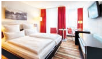
Leonardo Hotel Munich City West Brudermühlstraße 33 81371 Munich Phone +49 89 724 940 www.leonardo-hotels.de