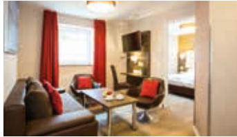
City Aparthotel Munich Sonnenstraße 18 b 80331 Munich Phone +49 89 461 353-0 info@city-aparthotel.de www.city-aparthotel.de/en/