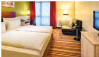
Leonardo Hotel and Residence Munich Heimgartenstraße 14 81539 Munich Phone +49 89 620 390 www.leonardo-hotels.de