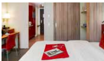
Hotel Adagio München City Schwanthalerstraße 61 80336 Munich Phone +49 89 121 12 20 www.adagio-city.com